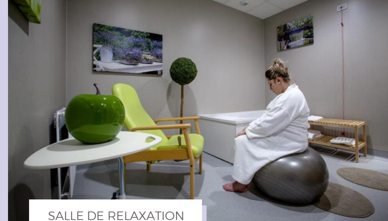
SALLE DE RELAXATION AVEC BAIGNOIRE

L'allaitement maternel au fil des mois : revenez avec bébé quelques semaines après l'accouchement pour partager un moment d'échange convivial avec d'autres mamans qui allaitent.